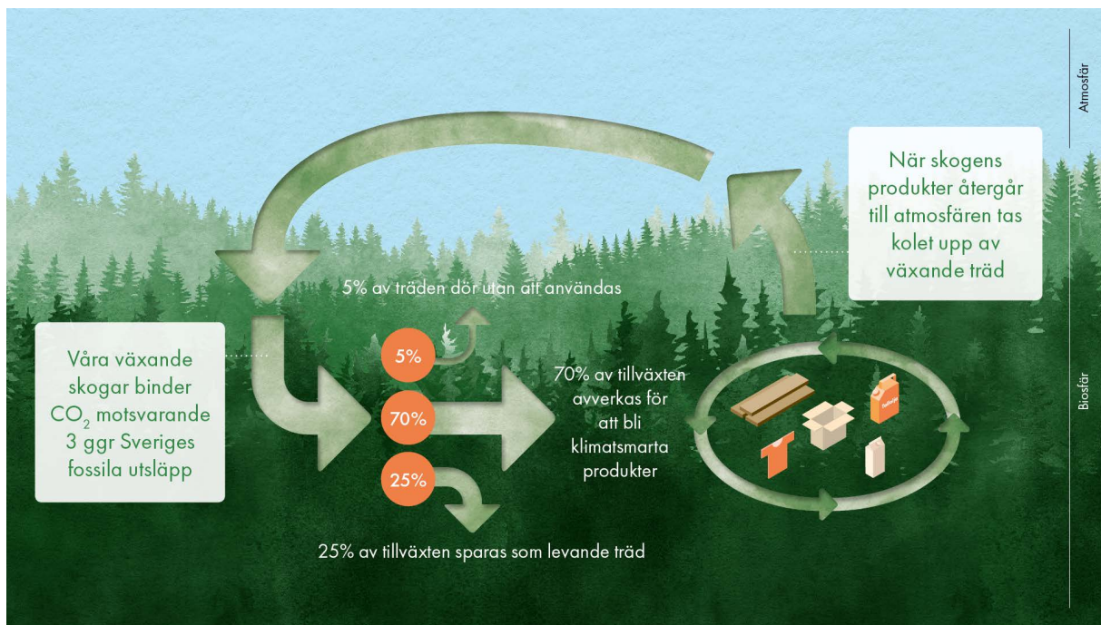
Figur 2. Den cirkulära biogena kolcykeln som ligger till grund för klimatsmarta produkter från den svenska skogen.